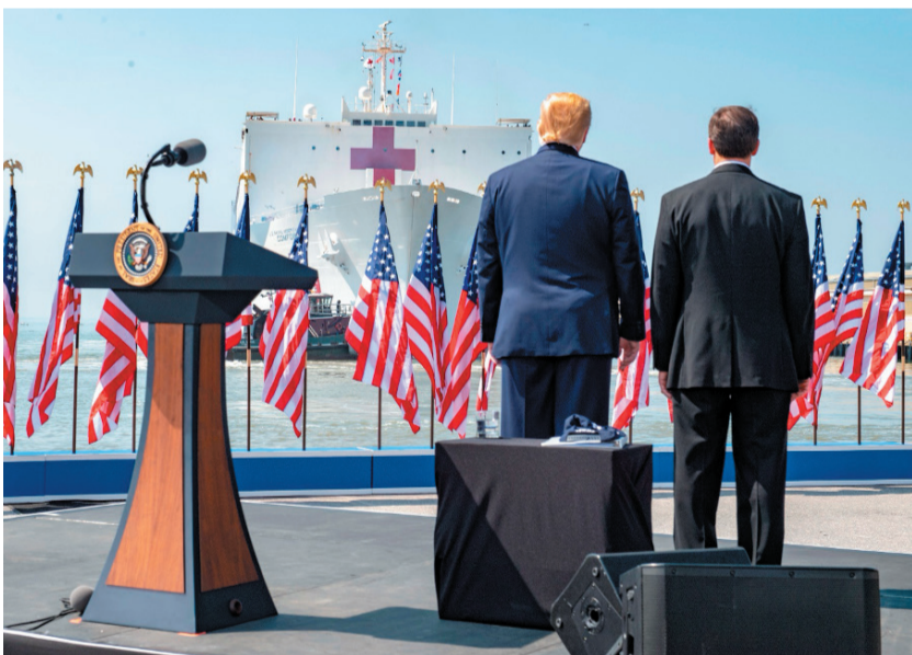
Le président Donald Trump et le secrétaire à la Défense Mark Esper regardent le navire-hôpital USNS Comfort quitter la base navale de Norfolk le 28 mars 2020 pour rejoindre New York en appui aux efforts de lutte contre la Covid-19 aux États-Unis.

« de lui-même » le 7 avril, comme l'appelait de ses vœux le président de la Commission des forces armées de la Chambre des représentants des États-Unis, le démocrate Adam Smith.