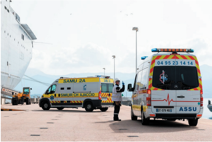
Deux ambulances embarquent à bord du PHA Tonnerre amarré au port d'Ajaccio afin de prendre en charge des patients atteints de la Covid-19 par l'hôpital du bord pour les transférer dans des établissements de santé de la région Provence-Alpes-Côte d'Azur.

Arrivé le 17 avril dans la baie de Marigot, à Saint-Martin, il y débuta sa « tournée logistique » avant de rejoindre le jour suivant la Guadeloupe, où une partie du fret fut embarquée à bord du bâtiment de soutien et d'assistance outre-mer (BSAOM) Dumont d'Urville pour être ensuite délivré à la Guyane, et, dès le lendemain, la Martinique. Si, comme ses « frères jumeaux », ce bâtiment de guerre n'est pas destiné à accueillir des malades souffrant du Covid-19, rien ne l'empêcherait, a priori , de prendre en charge d'autres patients dans l'hôpital embarqué, fort de ses 69 lits (avec extension possible).